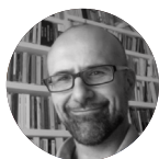
Alfonso García Figueroa

Catedrático de Derecho Constitucional. Magistrado del Tribunal Supremo.