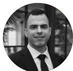
Renato Machado de Souza: Contraloría General de la Unión (Brasil)