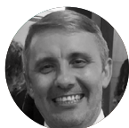
Vanir Fridriczewski: Supremo Tribunal Federal de Justicia (Brasil).