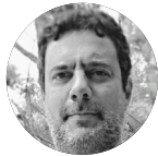
Omar Gabriel Orsi: Ministerio Público Fiscal (Argentina)